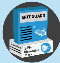
按照生产商说 明使用