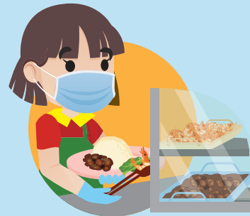
为顾客装盛熟食/即 食食品时