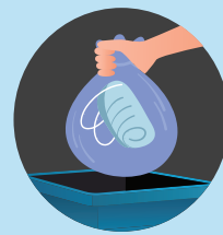
及时更换一次性口罩， 定期清洗布质口罩/防飞沫 护罩