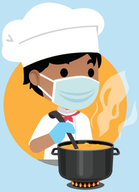
处理或准备食品和 食材时